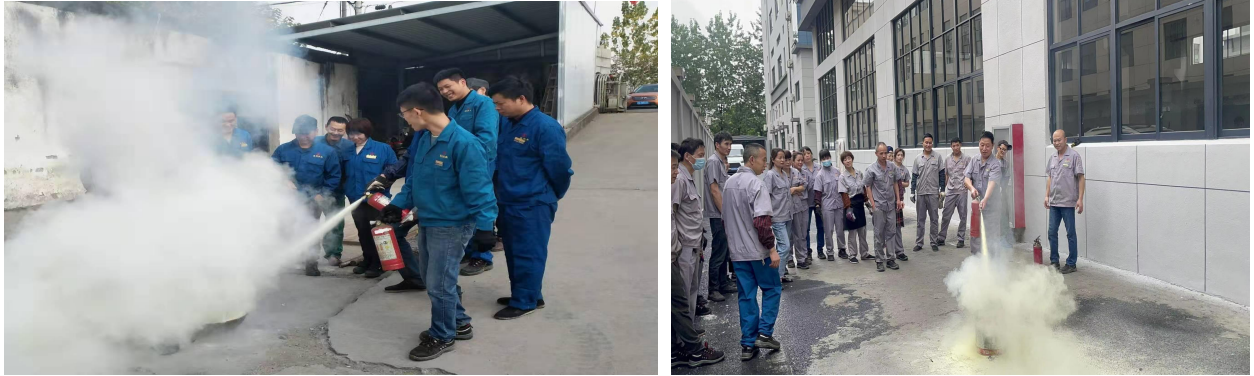
图 6.3-01 消防演练现场

案》等应急预案、《触电事件应急预案》、《重大设备故障应急预案》等应急处置方案等，对火灾、机械、触电等均有相应的应急措施，并成立了应急指挥中心和应急救援专业组。