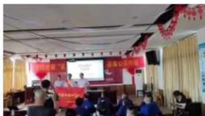
现场急救知识培训

公司将员工学习和发展视为“投资”，把创建学习型组织，营造全员学习的氛围作为公司长期发展战略的重要组成部分。随着公司规模扩大和全球化发展战略的实施，根据企业相关规定及各部门要求确定培训人员的需求情况。各部门负责人确定人员培训需求后经公司领导审批，相关部门每季度根据人员数量酌情进行培训计划的制定与实施。公司并成立了“唐能阀业商学院”，见图 3.2-1 所示。